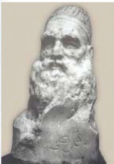
Кол Гали. Бакый Урманче скульптурасы

Кол Гали әсәренең нигезендә төш күрү вакыйгасыннан башланып киткән фаҗигале язмыш – ата һәм угыл мөхәббәте, Йосыфның Ягкубка тугрылыгы турында сөйләүче вакыйгалар ята. Бу инде егет белән кызның мөхәббәт тарихы гына түгел. Эчтәлек күпкә тирәнрәк, кинрәк, баерак. Игътибар иткәнсездер: шагыйрь биредә хөкемдар һәм гади халык бәхете проблемасын да куя. Ул хәтта әсәренң үзәгендә. Хөкемдар нинди булырга тиеш? Шагыйрь шул сорауга җавап эзли һәм таба. Ул аны әсәренң төп каһарманы булган Йосыфның кешелек сыйфатлары аша күрсәтә. Йосыф тугрылык, гаделлек, зирәклек, юмартлык, кыюлык һәм батырлык, олы жанлылык, кешеләргә ихтирамлы булу, тыйнаклык кебек гүзәл сыйфатларга ия. Шуңа күрә дә (чибәр булганы өчен генә түгел!) халык аны ярата, үз итә, якын күрә.