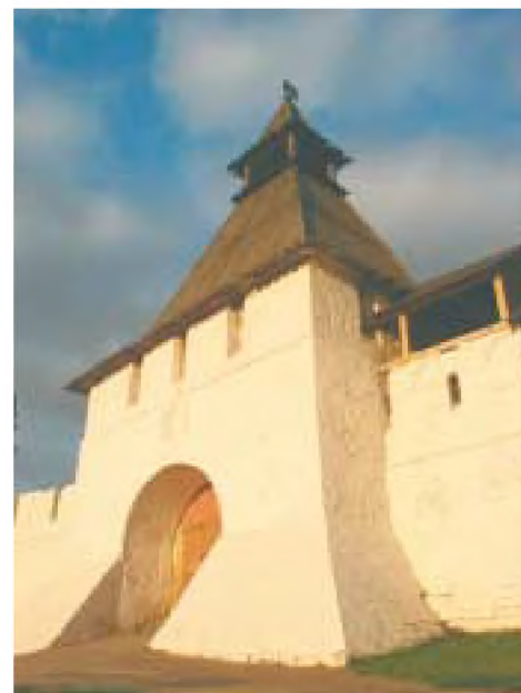
Казан Кремлендә Төмән манарасы

Шаһгали хан булып озак утыра алмый. 1552 ел башында Явыз Иван, аны хан дәрәҗәсеннән мәхрүм итеп, Казанга үзенә урынбасары рәвешендә кенәз Семен Микулинскийны жиберә. Барысы да аңа тугрылыкта ант бирергә мәҗбүр ителәләр. 9 мартта ул тантаналы рәвештә Казанга керергә тиеш була. Әмма аңа шәһәр капкасын ачучы булмый. Кенәз кире Зөя крепостена кайтып китә. Димәк, Казанны, Иван патша уйлаганча,