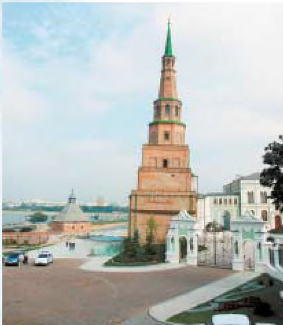
Казан Кремлендә Сөембикə манарасы

...Казан Кремле уртасында башына ярым ай куелган Сөембикə манарасы балкып тора. Ул шөһәрәбезнең борынгы архитектура символы. Бу манара хақында халыкта бик күп риваятьләр йөри. Менə аларның берсе. Имештер, Явыз Иван, Казанны басып алырга килгəч, Сөембикə ханбикəнең гүзəлlege, чибөрlege турында ишетеп, аны хатынлыкка алмакчы була һәм яучылар жибәрə. Горур һәм акыллы ханбикəбез əлеге тəkъдимнән баш тарта. Ачуы чыккан урыс патшасы сугышчылары белән Казанны камап ала. Сөембикə хэйлə кора: əгәр дə жиде тəүлек эчендə Иван патша жиде катлы манара тəзеп куйса, кияүгə чыгармын, ди. Иван риза була һәм тəзелеш эшләрə башланып китə. Жиде тəүлек дигəндə манара əзер дə була. Шул вакыт Сөембикə манарага күтəрелə һәм, урыс патшасына бирелергə телəмичə, жиргə ташлана. Шушы ва-