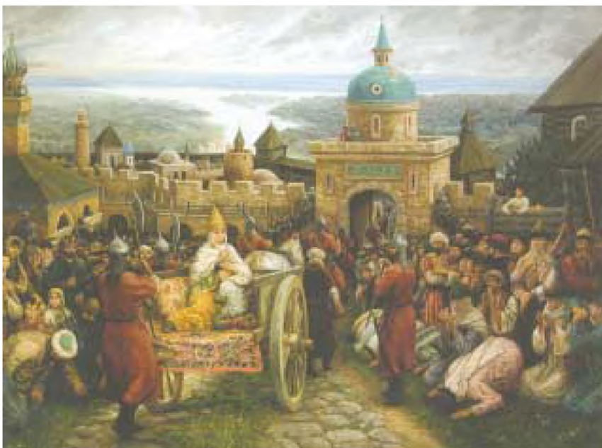
Сөембикәнең хушлашуы. Рәссам Фиринат Халиков картинасыннан репродукция

– Бәхетсезлек һәм фажиға кунды синең өскә, сөекле калам. Кайда югалттың син башындагы кыйммәтле, кодрәтле, азатлык нуры белән бизәлгән таҗыңны? Кем тартып алды аны синнән? Кем хәзер синең ирегеңне вә азатлыгыңны саклап кала алыр? Синең гайрәтле һәм дә акыллы ханың бу фани дөньядан күптән инде мәңгелек йортына күчте. Көчле-күәтле гаскәр башлыкларың – морза-угланнар хәлсезлән-