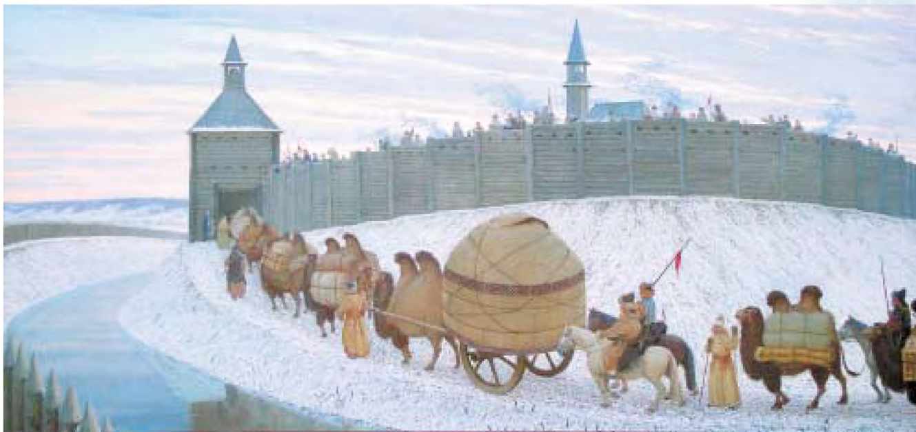
Кәрван. Рәссам Равил Заһидуллин картинасыннан репродукция

Кылыч үзенең Йосыфны ничек итеп мәсхәрәләвен, кылган рәхимсезлекләрен бәйнә-бәйнә сөйләп бирә. Барысы да, Йосыф каршысында тезләнеп, кичерү сорыйлар. Шул ук мизгелдә карлы-бозлы яңгыр тына, кояш чыгып, жир йөзе шатлангандай була. Кәрван хужасы юлдашларына фәрман бирә: