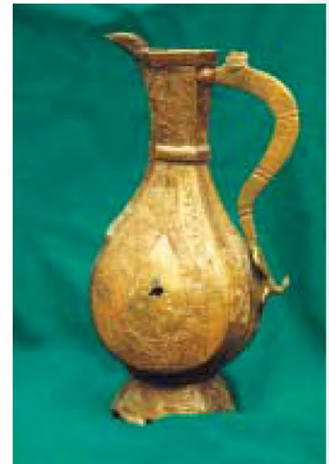
Жиз кувшин. Мөхәммәд Әмин хан вакытында Насыр исемле оста тарафыннан ясалган. XVI йөз башы

Сәхиб Гәрәй Казанда өч ел чамасы гына хакимлек итә. 1524 елда ул, үз урынына 13 яшен тутырган туганы Сафа Гәрәйне калдырып, ягъни аны хан итеп, үз теләге белән Кырымга кайтып китә. Урысларның яңа кенәзе Василий III Сафа Гәрәйне законлы хан итеп таний. Үсеп ирегет булгач, акыл кергәч, Сафа Гәрәй күрә: Мәскәү Казанны һаман үз кубызында биетергә чамалый. Бу аның рухына туры килми. Казан халкы кайчан урыс акылы белән яшәүдән туктар? Яшь хан киләчәктә ике арада кискен көрәш булачагын аңлый. Казанны өстәмә ныгытмалар белән уратып ала. Хәрби флот төзү эшенә керешә. Василий III бу тамашага тыныч кына карап тормый, Казанга сугышлар белән килә. Тыныч