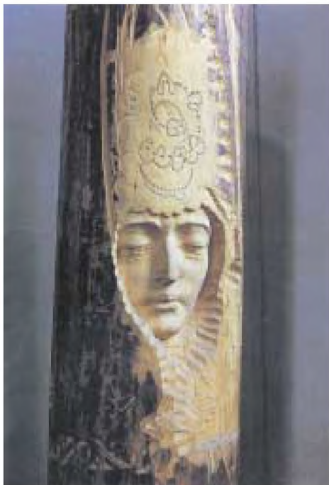
Сөембикә. Бакый Урманче скульптурасы

Шул заманнардан бүгенгә көннәргә кадәр килеп житкән халык ижаты әсәрләре бихисап. Ул әсәрләрдә Сөембикә тормышыннан алынган кызыклы мәгълүматлар китерелә, нигезендә чынбарлык яткан вакыйгалар тасвирлана. Алар тарих фәненең үсешенә дә этәргеч бирәләр. Сөембикә фаҗигасендә Казан ханлыгының тарихи фаҗигасе көзгедәге кебек ачык чагыла.