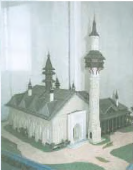
Биләрдәге Жәмигъ мәчете макеты. X – XIII гасыр башы. Реконструкция авторы – архитектор Нияз Халим

Урта Идел төбәгендә дә киң таралган катнаш төрки телдә язылган. XVIII – XIX йөзләрдә ижәт иткән чын татар шагыйрьләренең телләрен дә аңлау авыр. Хәтта Тукай шигырьләрендә дә гарәп-фарсы алынмалары күп. Аны бит гарәп йә булмаса фарсы шагыйре димиләр. Ә менә кайбер галимнәр «Кыйссаи Йосыф»ның авторын хәзерге Төркия жирлегеннән, Урта Азия якларынан эзлиләр. Аларның ялгышын татар галимнәре ачыклады инде. Төп һәм иң ышандыргыч дәлилләре шул: «Кыйссаи Йосыф»ның безгә мәгълүм барлык кулъязмалары да татарлар яши торган төбәкләрдә табып алынган диярлек. Башка төбәкләрдә яшәүче төрки халыklar поэманы белмиләр, димәк, үзләренеке итеп санамыйлар.