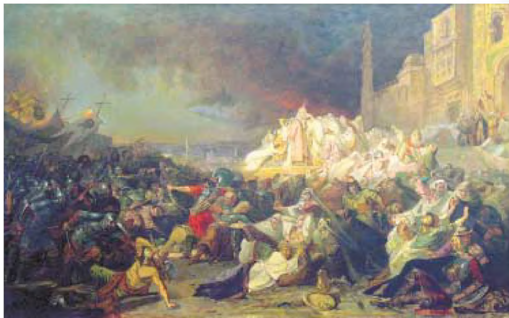
Казанны алу. 1552 елның 2 октябре. Рәссам Карл Вениг картинасыннан репродукция

2 октябрьдә Аталык капкасы янында колак тондыргыч көчле шартлау ныгытмаларның бер өлешен юкка чыгара. Ташлар, кешеләр, бүрәнәләр,